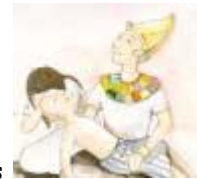
Plaga de mortandad de los primogénitos

4. Cuando Dios envió las plagas a Egipto, las plagas no llegaron a la tierra de Gosén donde vivían los israelitas. Por favor, busque las plagas que Dios envió distinguiendo al pueblo de Israel.