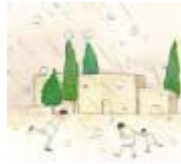
Plaga de granizo