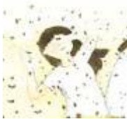
Plaga de moscas

3. ¿Por qué Dios envió las plagas a Egipto? Lea Éxodo 7:5 y escriba.